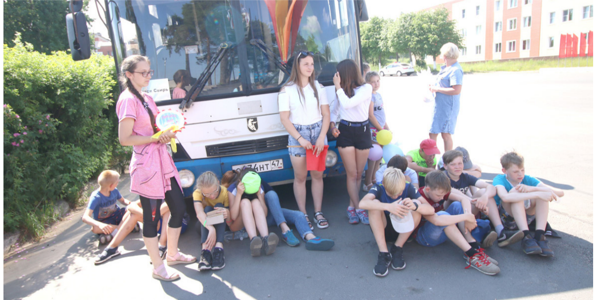
Марш мира! Жарко!