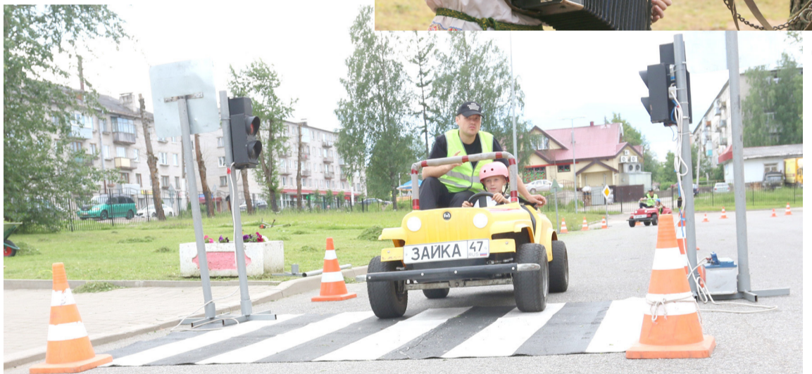
Учим правилам вождения