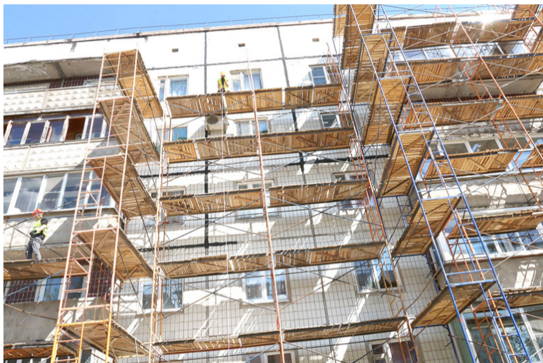
Улица Комсомольская, д. 17. Капремонт