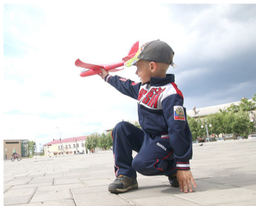
На городской площади