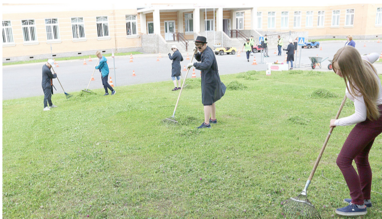
Школа № 3 – труд и отдых