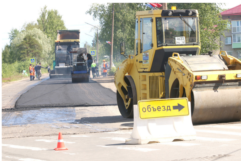
Ремонт дороги на улице Кирова