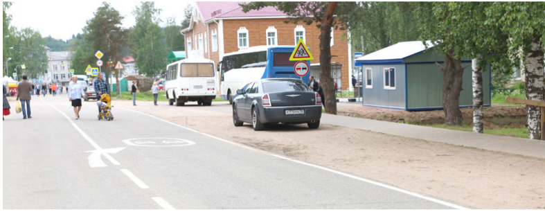
Виницы, новый автовокзал